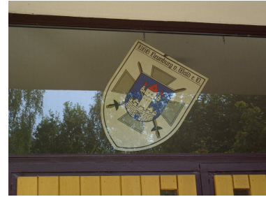
Die Pfalzgraf-Johann-Kaserne im August 2009