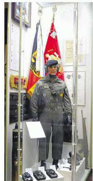
Bundeswehr-Vitrine im Museum

Der Verein die „Alten 115-er“ hatten dem Museum die jetzt ausgestellte Fahne des Artilleriebataillons übergeben.