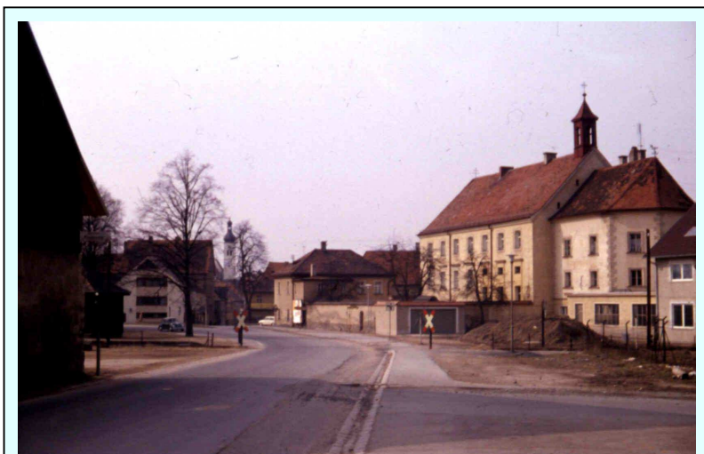
Neunburg 1969 - Klosterkirche, links der Ostbahnhof (verdeckt – Neunburg hatte zwei Bahnhöfe!)